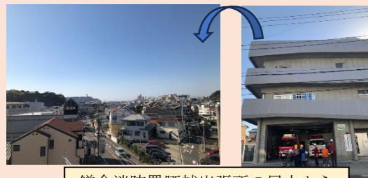
鎌倉消防署腰越出張所の屋上から見た町、高い場所が少ない

鎌倉市社会福祉協議会からの依頼で地域福祉の表彰者へお渡しする記念品として、虹の子作業所さんのクッキー、りっしん洞さんのコーヒー、スローライフの織り製品とともにラッピングして納品いたしました。